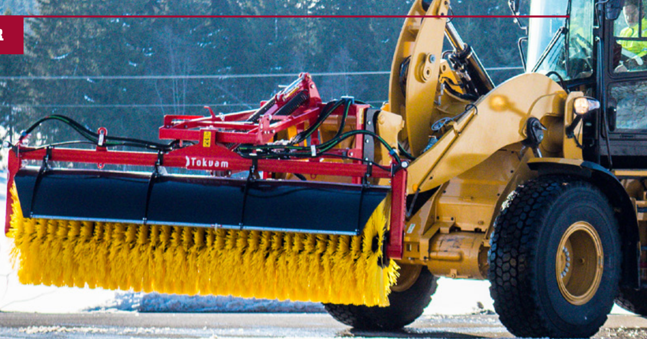
FK 900 - 3,0m - her vist med Cat 930 hjullaster.