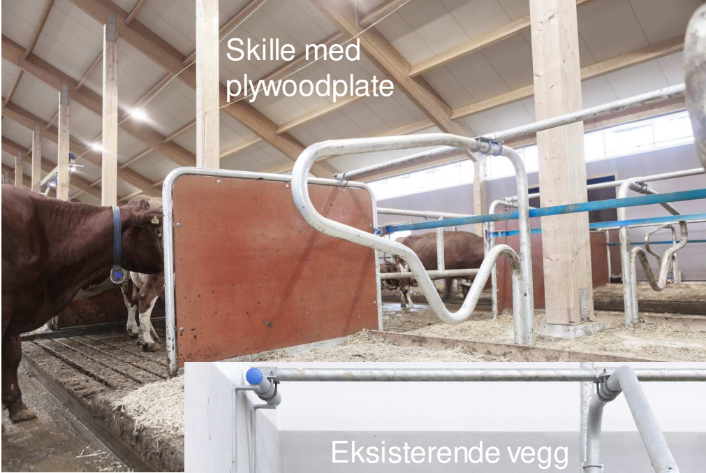
Eksisterende vegg eller betongskille