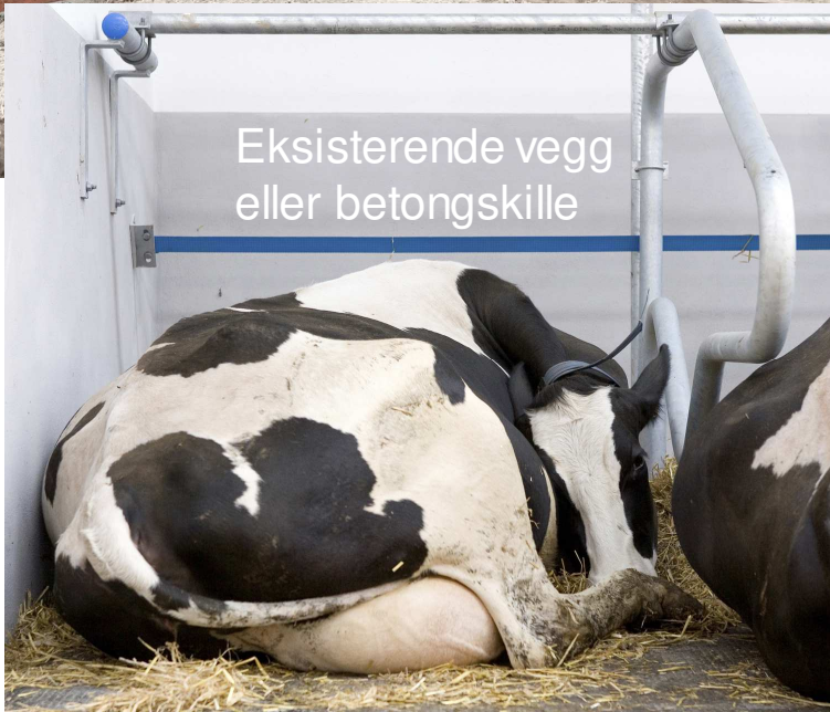
Eksisterende vegg eller betongskille