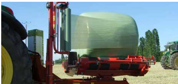
Balle- og vikleteller er standard.