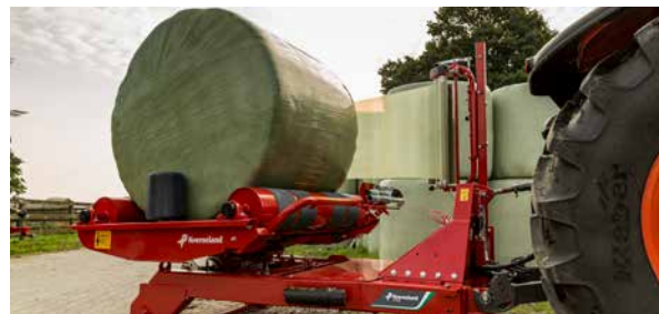
Kan håndtere rundballer opp til 1200 kg.