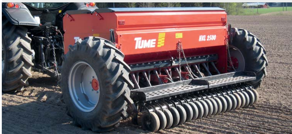
Stigbrett (HKL 2500 S) Gummitrykkroller med stigbrett