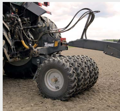
Mellompakker (HKL 2500 S)