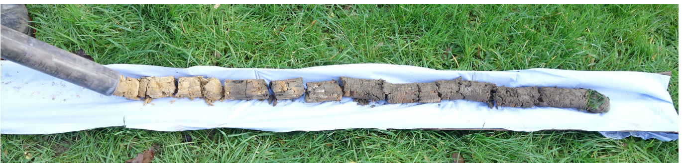
Fjern fotjekken og skyv jordprøven forsiktig inn i prøverøret. Sett på endestykket.