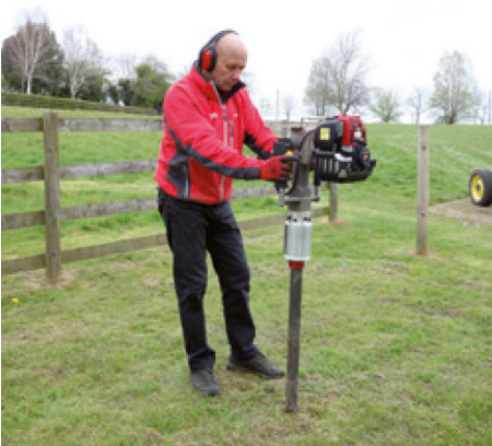
Sett 54 mm reduksjonsadapter på stolpebankeren.