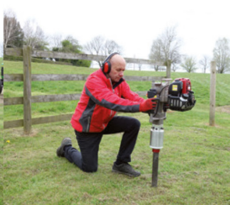
Plasser stålprøverøret på ønsket sted, og kjør rørets fulle lengde i bakken ved hjelp av stolpebankeren.