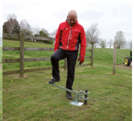
Fjern stolpebankeren og sett på plass fotjekken. Bruk fotjekken til å heve røret opp av bakken.