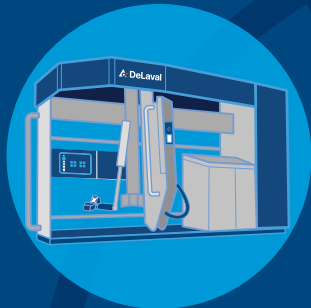
DeLaval VMS™ Serien

Vi leverer løsninger som hjelper deg å få mer melk, av bedre kvalitet, fra sunnere dyr. Det er derfor vi ikke bare fokuserer på en del av melkeprosessen. Vi utvikler, produserer, installerer og vedlikeholder hele systemer, og vi sikrer kvaliteten og påliteligheten til hver komponent i disse systemene.