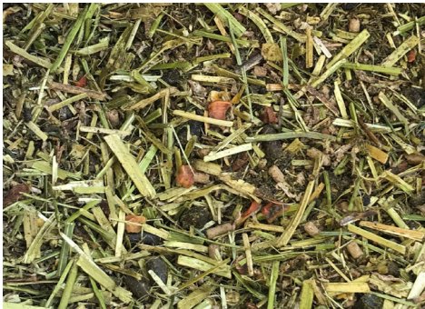
Et fristende müslifôr med alt hesten synes smaker godt.

Siden Champion Diamant hovedsaklig er fiberbasert, tåler hesten i mange tilfeller å få hele dagsrasjonen i samme måltid. Etter at hesten er tilvendt fôret kan inntil 0,35 kg per 100 kg kroppsvekt fôres i ett måltid. For mange er det praktisk å kun tildele kraftfôr når man likevel er i stallen for å trene hesten.